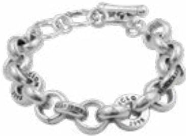
LIBERTAD Y PODER Ref.-232107 Talla única