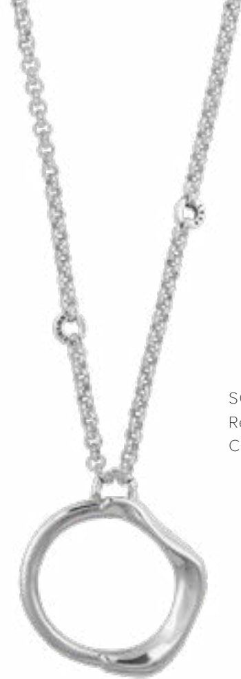
SOL Y LUNA Ref.-232801 Collar largo