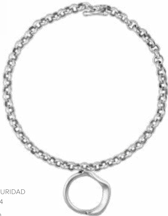
LUZ Y OSCURIDAD Ref.-232804 Collar corto