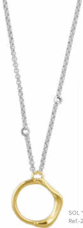
SOL Y LUNA Ref.-230801 Collar largo