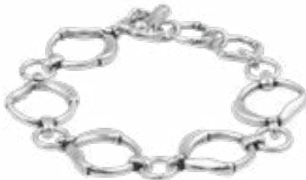
DÍA Y NOCHE Ref.-232102 Talla única