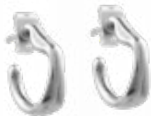
DÍA Y NOCHE Ref.-232600