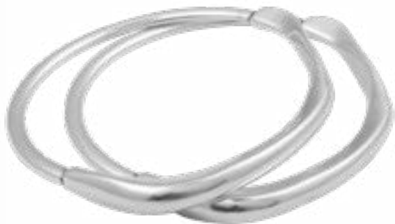
SOL Y LUNA Ref.-232101 2 tallas Talla 1 (Pequeña) Talla 2 (Mediana)