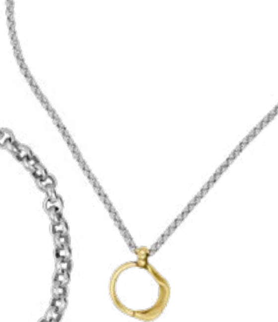
MAR Y TIERRA Ref.-230802 Collar corto