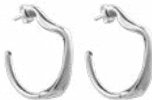
SOL Y LUNA Ref.-232601