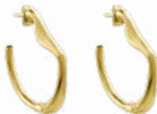
SOL Y LUNA Ref.-230603