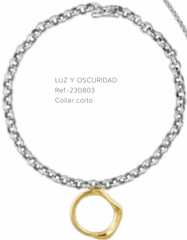
LUZ Y OSCURIDAD Ref.-230803 Collar corto