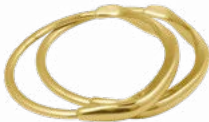
SOL Y LUNA Ref.-230103 2 Tallas Talla 1 (Pequeña) Talla 2 (Mediana)