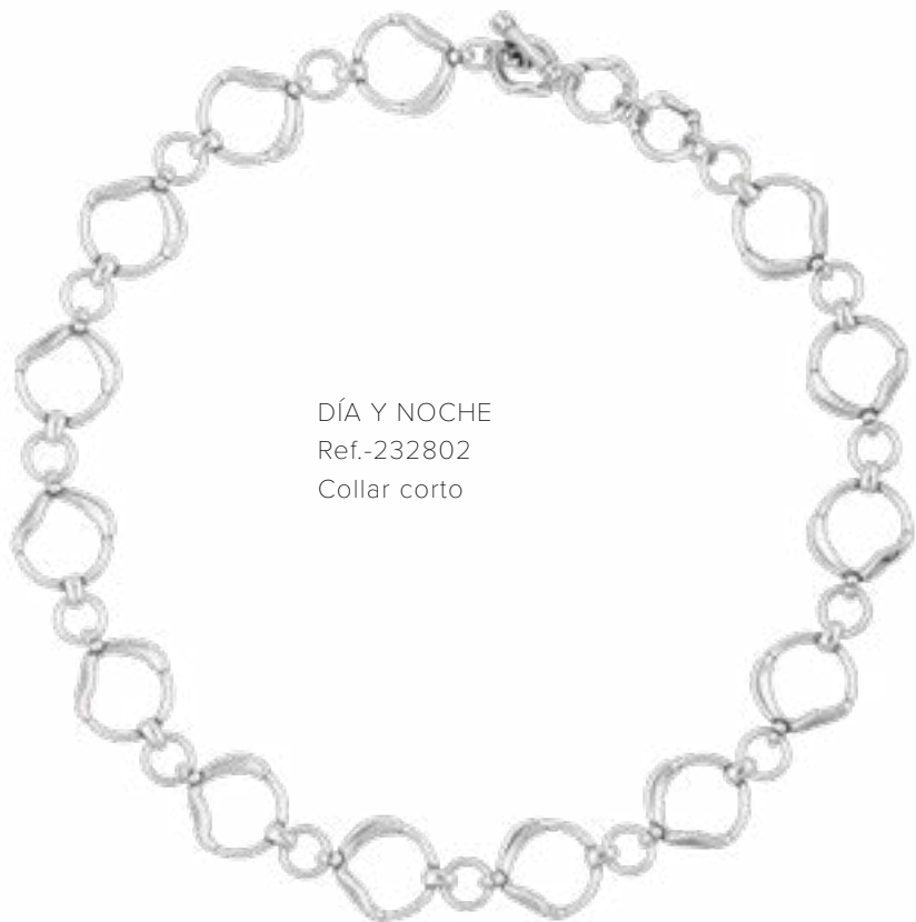
DÍA Y NOCHE Ref.-232802 Collar corto